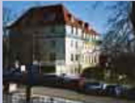
Haus der PARITÄT, Sitz der Landesgeschäftsstelle des PARITÄTISCHEN Thüringen.

Die hauseigene Cafeteria stimmt die Versorgung auf Ihre Bedürfnisse ab. Erfrischungen stehen auf Wunsch in den Tagungsräumen bereit.